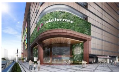
ららテラス川口店イメージ写真

「三井ショッピングパーク ららテラス川口」は、2025年5月に開業予定と発表されました。リニューアルにあたってのコンセプトは「在るもので、新しく」とし、長きにわたり地域に親しまれてきた「旧そごう川口店」のレガシーである大時計や大理石などを継承しながら、地域住民の生活ニーズを満たすバラエティー豊かな約100店舗が揃います。地下1階は食料品・フードコート、1～3階はファッション&ビューティー&雑貨、4～8階は大型専門店を中心に配置されます。さらに、従業員満足度向上を目指し、機能が充実した休憩室・専用喫煙室を館内に設置されます。すでに一部出店店舗が公表されているので気になる方はお調べください。今後、川口駅がどのようなになるのか楽しみです。