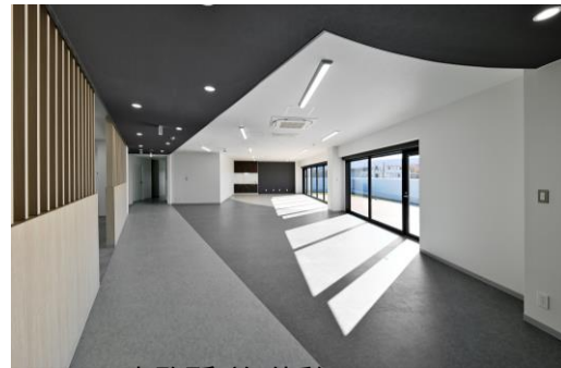
事務所兼休憩スペース